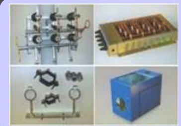
Assemblaggio di prodotti finiti